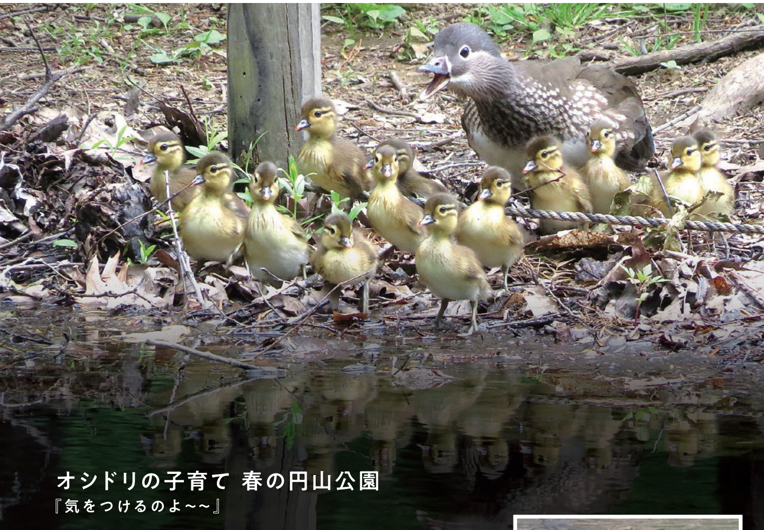
オシドリの子育て 春の円山公園 「気をつけるのよ〜」

母親の羽の中でうたた寝をしていた雛がいっせいに飛び出しました。毎年4月、円山公園の池の水がとけるころ「世界一美しい鴨」といわれるオシドリ達が渡ってきます。