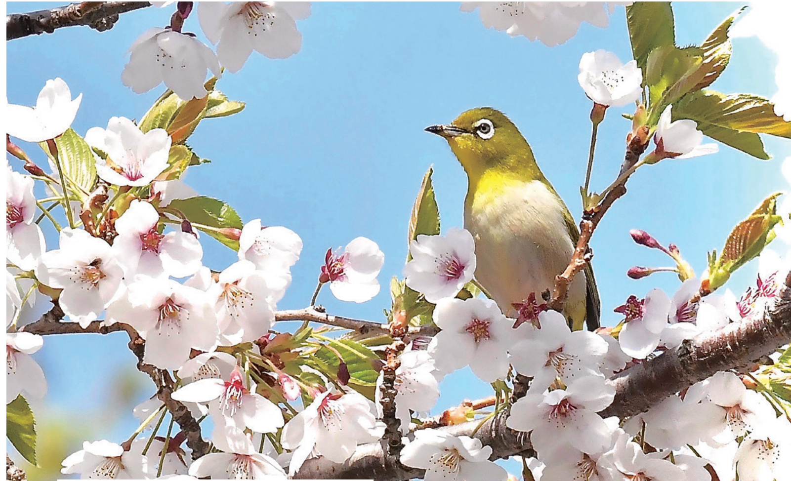
メジロ (西岡森林総合研究所5月)