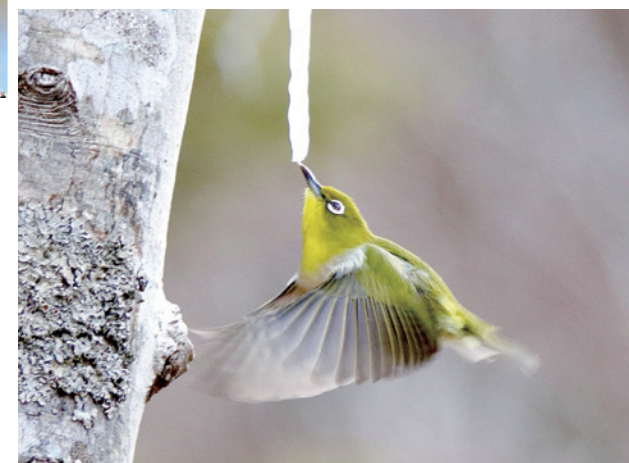
雪解け頃に出る樹液(メイプルシロップ)の甘いツララを舐める越冬メジロ(3月)

春を代表する鳥と言えばメジロ!そして桜と青空でしょうか? メジロは甘いものが大好きです。桜の花が咲く頃になると「チーチー」と鳴き 交わり、花から花へと、蜜を求めにやってきます。メジロの舌は筆のよう にフサフサとして、蜜が絡むようになっています。よく「メジロ」と「ウグイス」 が混同されますよね。「ホーホケキョ」とウグイスのさえずりは耳にしますが、 姿は灰褐色で警戒心が強いので見つけにくいのです。しかしメジロは 警戒心が弱く、よく目にするので皆に親しまれる野鳥です。 そしてなんと不思議なことに、「メジロ」が「ウグイス色」なのです。