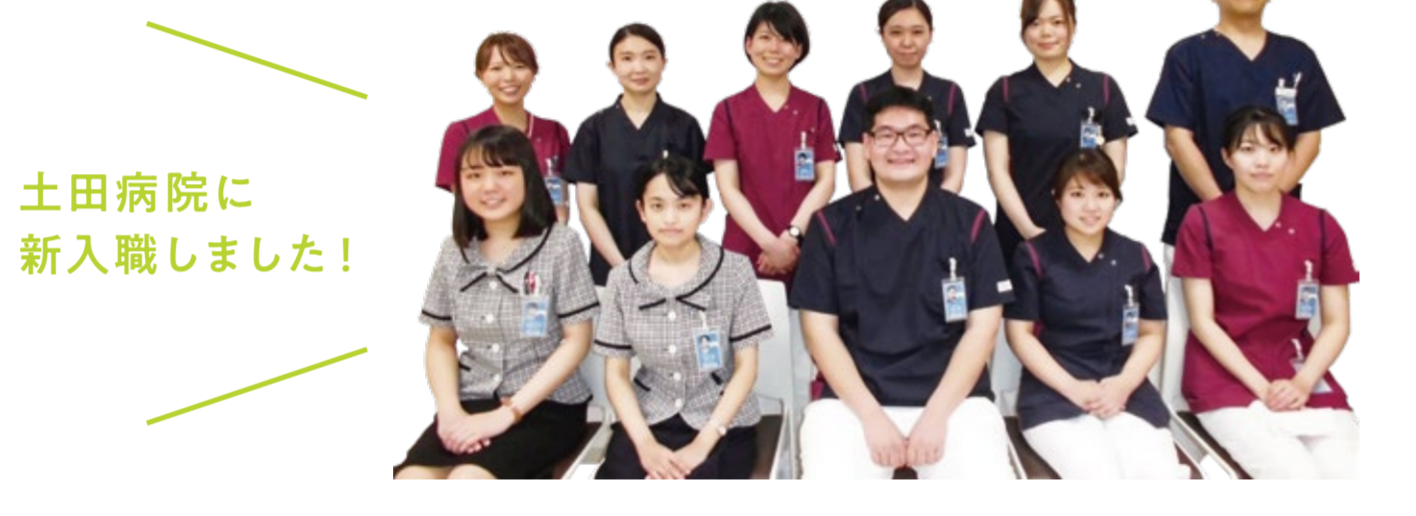
土田病院に新入職しました！