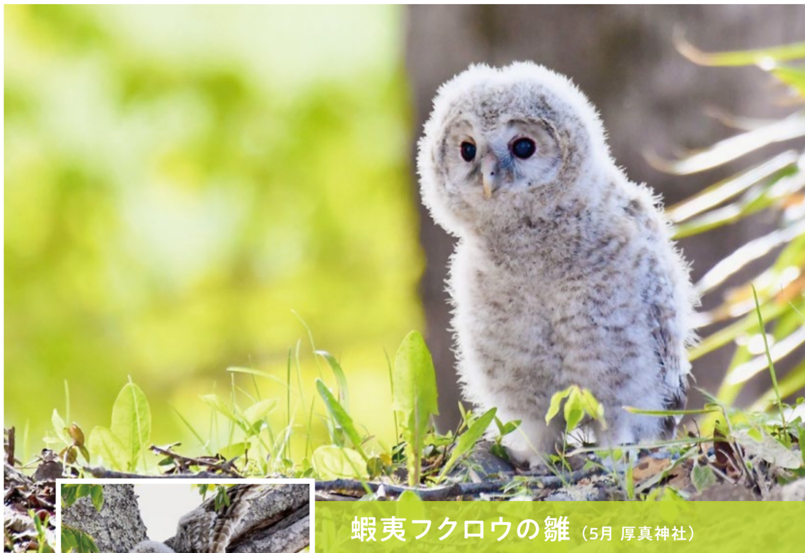
蝦夷フクロウの雛 (5月 厚真神社)

新緑がまぶしくなるころ、春を待ち焦がれたフクロウの雛たちが洞から出てきます。この日は風が強く、揺れる木に堪えられず落ちてきた…さあ大変です。まだ飛べない雛は一步一步のぼりだした。時間をかけ、上から見守る親の元へたどり着く事が出来ました。たどたどしい幼鳥も、やがて「森の名狩人」へと成長していくのです。フクロウは視覚が鋭く(パラボラアンテナのような顔で音を拾い集める)広い視野を持ち(首は上下左右270度回転)、音を立てずに飛べる繊細な羽と、刃物のような爪で獲物をキャッチし、丸ごと飲み込むのです。親子フクロウは厚真神社の門番と鎮守として、震災の復興を見守ってくれることでしょう。